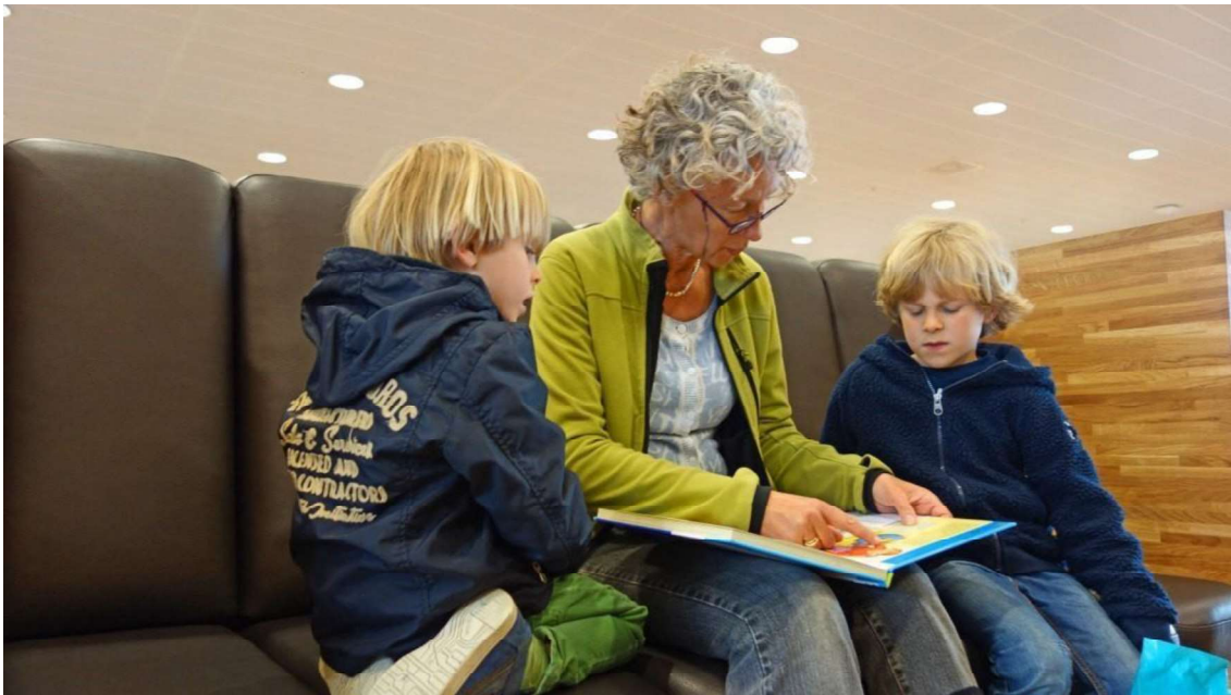
Imagen 1: Abuela leyendo un cuento (género narrativo) a sus nietos.

Una vez definido qué es el género narrativo, pasaremos a analizar sus características.