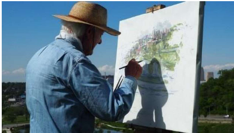
Imagen 1: Hombre pintando un lienzo. Autor: Jake W. Heckey

Fuente: Pixabay.com . Licencia: Dominio público .