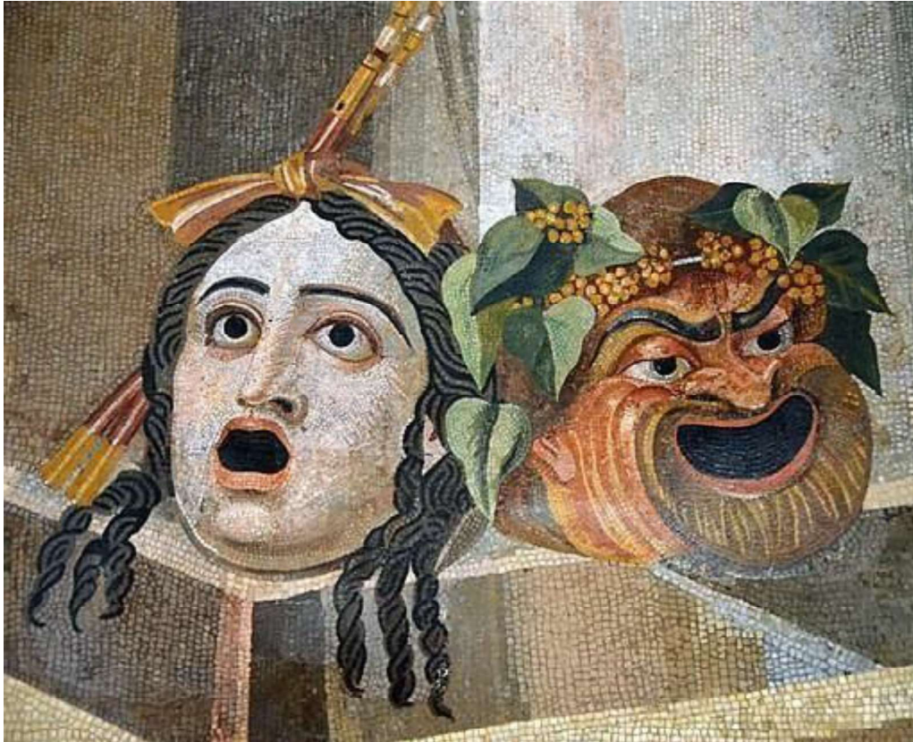
Imagen 3: Foto de las máscaras de la tragedia y la comedia (mosaico romano).

Es un género intrínsecamente escrito, ya que se necesita de un texto para que los actores memoricen los diálogos que van a ser representados ante el público.