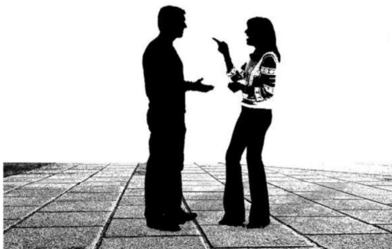
Imagen 1: Conversación.

En este tema nos vamos a centrar en los distintos tipos de textos dialógicos, así como sus características. Terminaremos con varias pautas para desarrollar un buen diálogo oral y llevar a cabo una entrevista de éxito.