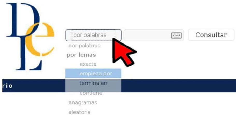
Imagen nº 2: Herramientas del diccionario de la RAE. Autor: Eugenio Higuera.

En la imagen de abajo se muestra con una flecha roja el lugar donde hay que hacer clic para acceder a estas opciones: