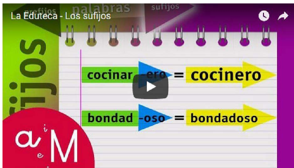
Vídeo nº 1: Los sufijos. Autor: La Eduteca.

En este vídeo nos explican en qué consiste la derivación de palabras por sufijación. Si eres de los que prefiere ver y escuchar a leer, esta es tu oportunidad para entender los sufijos: