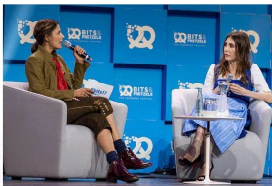
Imagen 2: Entrevista.