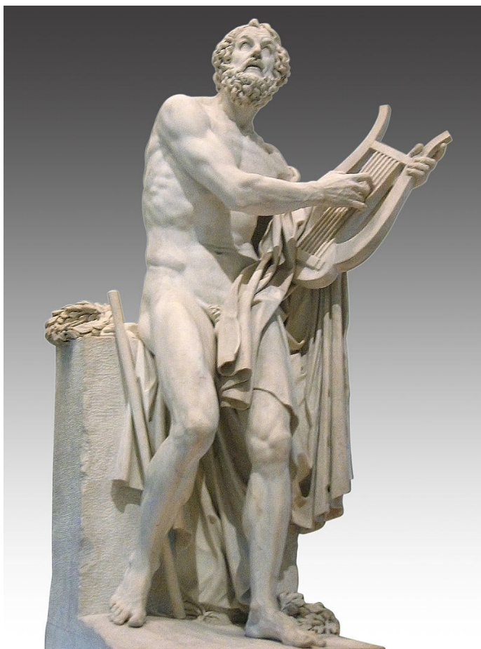
Imagen nº 4: Homero. Autor: Desconocido Fuente: Wikipedia . Licencia: Creative Commons https://it.wikipedia.org/wiki/Omero#/media/File:Homer_by_Philippe-Laurent_Roland_(Louvre_2004_134_cor).jpg