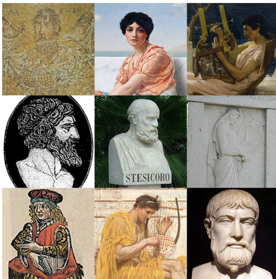
Imagen nº 5: Poetas líricos. Autor: Desconocido.

Fuente: Wikipedia . Licencia: Creative Commons