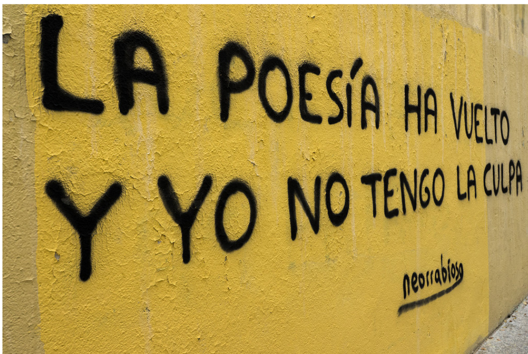
Imagen nº 2: Pintada poética. Autor: Desconocido

Otra característica propia de muchos textos literarios es el uso del verso . Este consiste en someter al lenguaje a unas pautas establecidas, de forma que nos encontramos con unidades lingüísticas limitadas por pausas y sometidas a una cadencia marcada. Sin embargo, también nos encontramos textos literarios escritos en prosa , que carece del ritmo propio del verso.