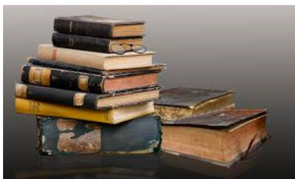
Imagen nº 1: Libros antiguos. Autor: Desconocido Fuente: Pxhere . Licencia: Creative Commons https://pxhere.com/es/photo/1201587

Según el diccionario de la Real Academia, la literatura es el "arte de la expresión verbal". Es decir, habrá literatura cuando usemos el lenguaje con una finalidad estética. Esto plantea un problema, ya que el lenguaje es un instrumento para la comunicación cotidiana y pueden surgir dudas sobre cuándo se usa este instrumento para una finalidad artística.