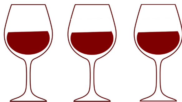
Imagen nº 1: Copas. Autor: desconocido

Fuente: Pixabay . Licencia: Creative Commons