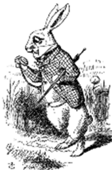
Imagen 3 : Conejo blanco de Alicia en el país de las maravillas

PITOL, Sergio: Prólogo de Alicia en el País de las Maravillas , Ed. Porrúa, S.A.