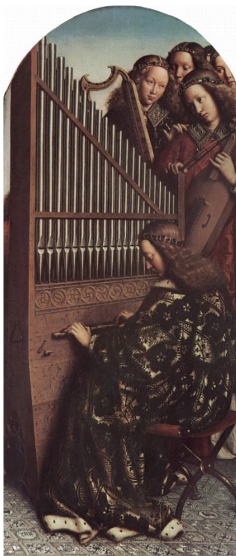
Imagen 2: Representación de un órgano de Hubert Van Eyck

El órgano es un instrumento de viento (acrófono), como lo son, por ejemplo, la flauta y la trompeta. El viento del órgano lo produce el FUELLE que está situado en la parte inferior del mueble. Antiguamente, se accionaba a mano mediante una palanca, pero hoy día se alimenta con ventiladores eléctricos. El viento producido en el fuelle pasa a una caja herméticamente cerrada que se llama SECRETO, en cuya tapa están encajados los TUBOS, de distinta longitud y diámetro, que producen los sonidos y que se ordenan en diferentes hileras (aunque existen órganos con una sola hilera de tubos). Por medio del teclado, el organista selecciona los tubos que deben sonar y cuáles deben permanecer en silencio.