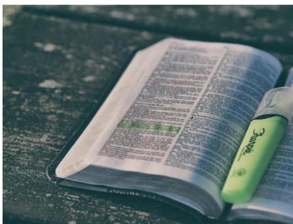
Imagen 1: Libro Fuente: Pixabay Licencia: Creative Commons

https://pixabay.com/es/biblia-libro-resaltador-p%C3%A1gina-1867195/