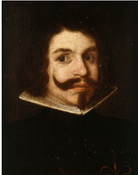
Imagen nº 7. Baltasar Gracián. Autor: Desconocido

En cuanto a la prosa barroca, tenemos la prosa novelesca, destacando sobre todo el género picaresco, y la literatura didáctica y doctrinal. El escritor más representativo, además de Quevedo con el Buscón , destaca Baltasar Gracián, autor de Agudeza y arte de ingenio y El Criticón , novela alegórica que ofrece una visión pesimista del mundo.