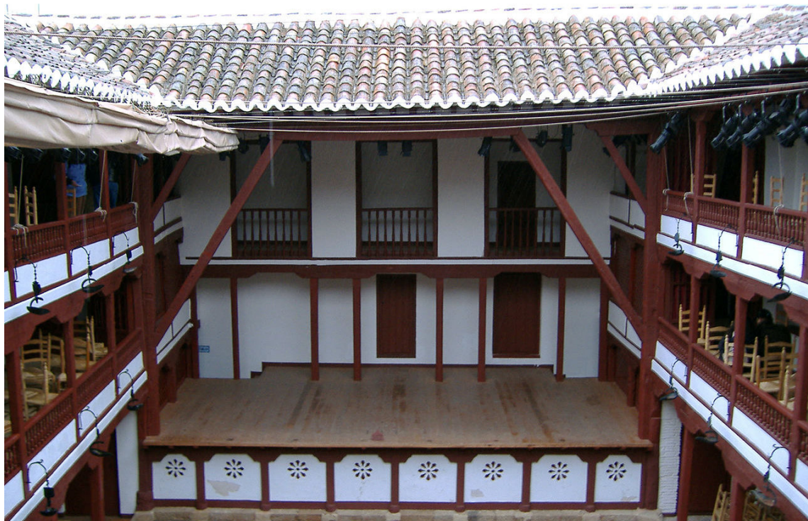
Imagen nº 4. Corral de comedias de Almagro. Autor: Desconocido

Estas comedias son representadas ante público en los corrales de comedia, locales específicos para la representación teatral. Las obras teatrales se dividen en tres actos llamados jornadas que se corresponden con planteamiento, nudo y desenlace de la intriga. Se mezcla lo trágico y lo cómico y, curiosamente, las obras teatrales se escriben en verso, con gran variedad de medidas y estrofas, adecuando siempre el lenguaje a los personajes que intervienen.