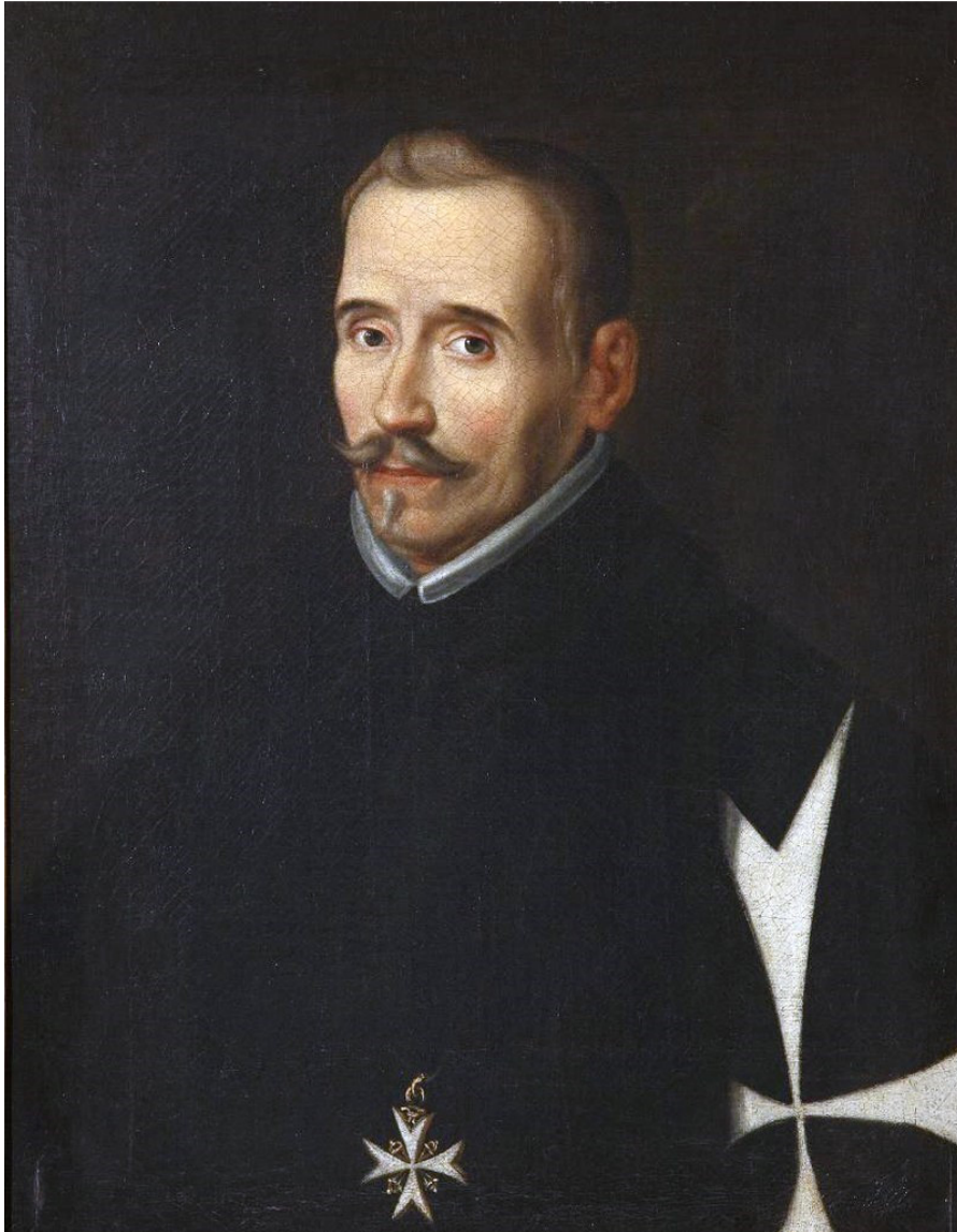
Imagen nº 5. Lope de Vega. Autor: Desconocido Fuente: Wikipedia. Licencia: Creative Commons https://es.wikipedia.org/wiki/Lope_de_Vega#/media/File:LopedeVega.jpg

Félix Lope de Vega (1562-1635), de vida muy agitada, se dedicó plenamente a la literatura, y fue autor de una gran producción literaria. Su éxito popular fue arrollador, pues comprendió cual era el gusto del público e inició la revolución teatral de la comedia barroca. Entre sus títulos más famosos abundan dramas sobre el uso injusto del poder y conflictos de honra, inspirados en temas legendarios o populares: Fuenteovejuna , Peribáñez y el comendador de Ocaña , El caballero de Olmedo y El mejor alcalde, el rey , entre otras.