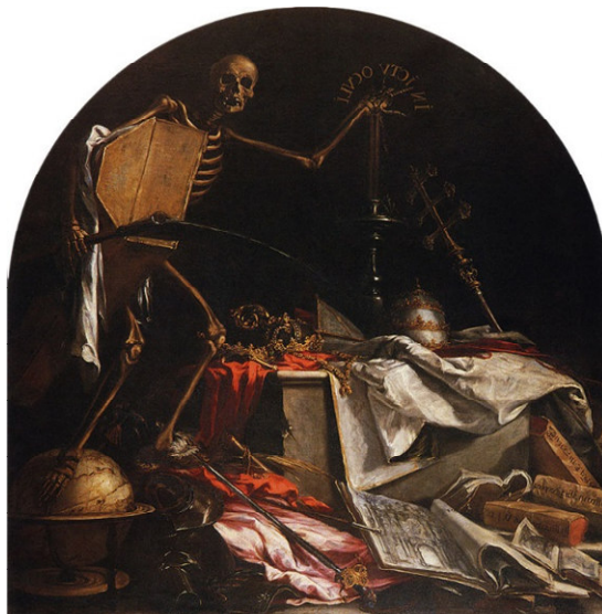
Imagen nº 1. In ictu oculi. Autor: Valdés Leal .