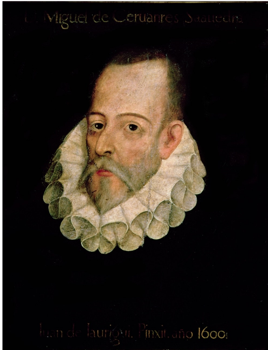
Imagen nº 8. Cervantes. Autor: Juan de Jáuregui

En 1587, ya casado, trabajó de recaudador de tributos por toda Andalucía. Este trabajo lo llevó a una breve estancia en la cárcel de Sevilla, donde se supone que se engendró el Quijote .