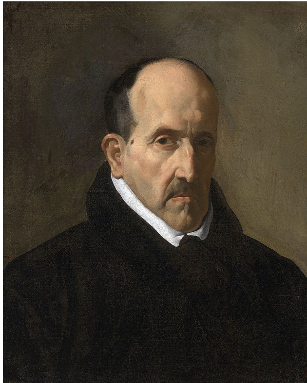
Imagen nº 2. Luis de Góngora. Autor: Velázquez Fuente: Wikipedia . Licencia: Creative Commons

Su autor más destacado como ya señalábamos será Luís de Góngora.