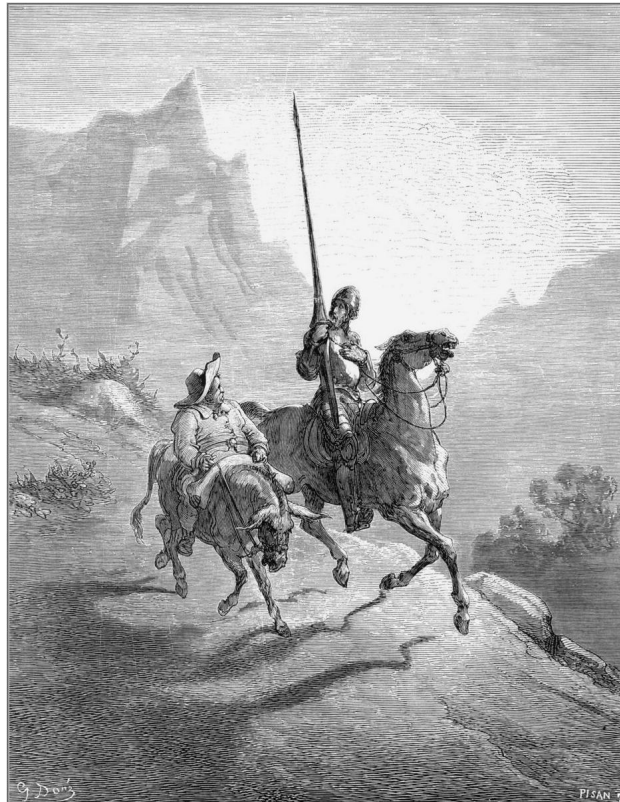
Imagen nº 9. Don Quijote y Sancho. Autor: Doré Fuente: Wikipedia. Licencia: Creative Commons

Se trata de la obra más famosa de Cervantes. Fue publicada en dos partes. La primera en 1605 con el título de El ingenioso hidalgo don Quijote de la Mancha y la segunda en 1615 con el de Segunda parte del ingenioso caballero don Quijote de la Mancha .