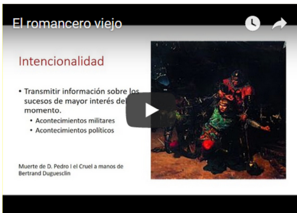
Vídeo nº 1. El romancero viejo.

Ve el siguiente vídeo sobre el romancero y completa el texto con las palabras del recuadro: