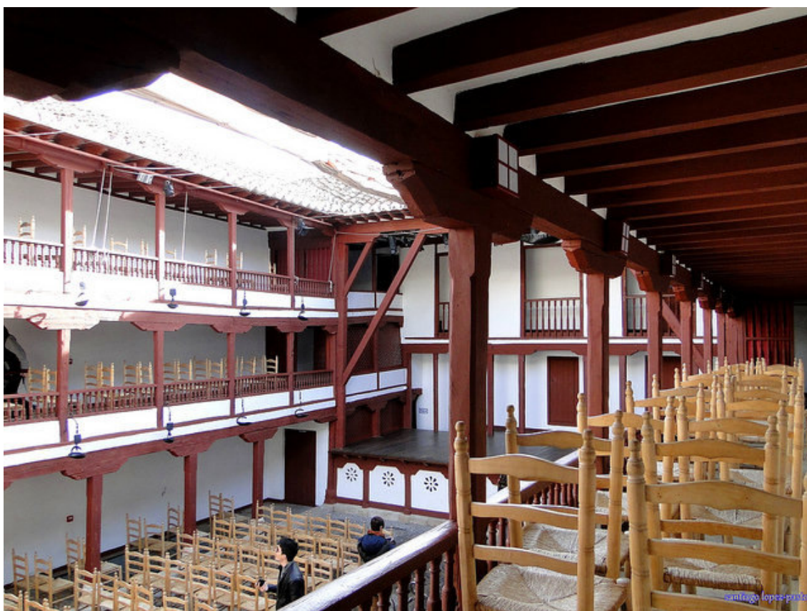
Imagen nº 2: Corral de comedias de Almagro. Autor: Santiago López Pastor

Fuente: https://www.flickr.com/photos/100759833@N05/24534301189/