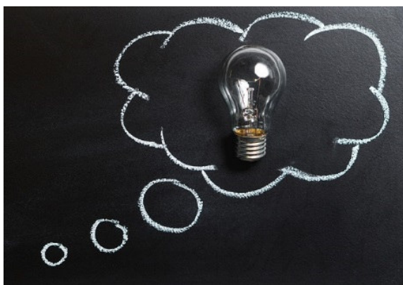
Imagen nº 2: Bombilla Fuente: Pixabay Licencia: Creative Commons https://pixabay.com/es/pensamiento-idea-innovaci%C3%B3n-2123970/