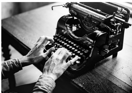
Imagen 4: Máquina de escribir Fuente: Pixabay Licencia: Creative Commons

https://pixabay.com/es/m%C3%A1quina-de-escribir-antigua-alfabeto-2242164/