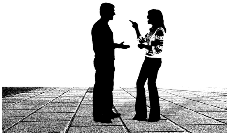
Imagen 1: Conversación Fuente: Pixabay Licencia: Creative Commons

La argumentación se utiliza en una amplia variedad de textos, especialmente en los científicos, filosóficos, en el ensayo, en la oratoria política y judicial, en los textos periodísticos de opinión y en algunos mensajes publicitarios. En la lengua oral, además de aparecer con frecuencia en la conversación cotidiana (aunque con poco rigor), es la forma dominante en los debates, coloquios o mesas redondas.